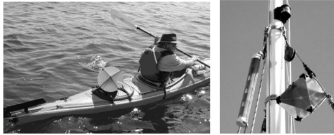
Gambar 1. Penempatan radar reflector pada canoe dan tiang mast kapal

pada kapal ikan adalah radar reflector. Radar reflector berfungsi untuk memantulkan kembali gelombang radar dari kapal besar, terutama pada kapal-kapal kecil yang terbuat dari material non logam seperti kapal kayu dan Fiberglass Reinforced Plastic (FRP), sehingga keberadaan kapal kecil yang terpasang radar reflector dapat terdeteksi oleh kapal besar. Pemasangan radar reflector dapat dilihat pada Gambar 1.