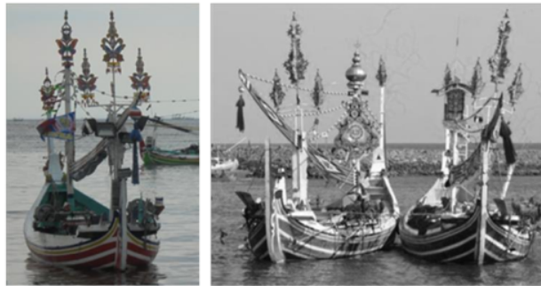
Gambar 2. Ornamen pada kapal ikan Slerek di Muncar

bentuknya yang sederhana dengan metode pembuatan yang relatif mudah, namun sangat efektif dalam mencegah kemungkinan tubrukan dengan kapal-kapal besar. Tetapi pada kenyataannya radar reflector belum menjadi peralatan navigasi yang umum dijumpai pada kapal-kapal ikan di Indonesia khususnya kapal-kapal ikan tradisional. Kondisi ini terutama disebabkan karena belum dikenalnya teknologi radar reflector oleh komunitas nelayan di berbagai daerah di Indonesia. Disamping itu, diperlukan waktu yang relatif lama untuk memperkenalkan suatu teknologi baru kepada komunitas nelayan di Indonesia.